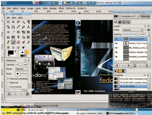
Mengerjakan tugas desain cover DVD dengan menggunakan aplikasi GIMP.